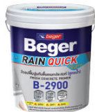
สีรองพื้นปูนกันชื้นออกประสมก (สูตรน้ำ) เบเยอร์ เรนควิก ไพรมอร์ บี-2900