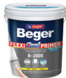
สีรองพื้นปูนออกประสมก เบเยอร์ เฟลิกซ์คูล ไพรมอร์ บี-2800