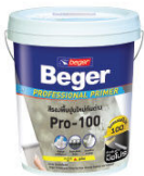
สีรองพื้นปูนใหม่กับปูนเก่า เบเยอร์ โปรเฟสชั่นแนล ไพรมอร์ บี-100

For perfect protection system ระบบสีครบวงจรเพื่อการปกป้องบ้านสมบูรณ์แบบ