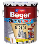
สีรองพื้นปูนออกประสมก กันชื้นสูง เบเยอร์ ซุปเปอร์ควิก ไพรมอร์ บี-2100