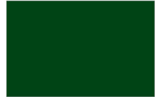
R-3779 Dark Green เขียวเข้ม