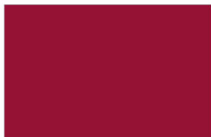
R-3400 ★ Royal Red แดงดาหลา