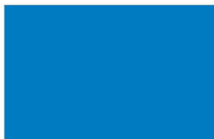
R-3018 Early Blue ฟ้ารุ่งอรุณ