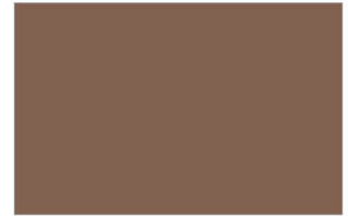
R-3575 Brownish Orange หมากสุก