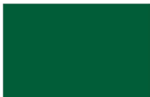
R-3200 ★ Royal Green เขียวพุดชา