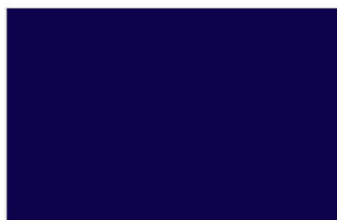
R-3014 Dark Blue น้ำเงินเข้ม