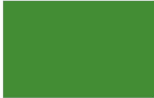
R-3770 Med Green เขียวหยก