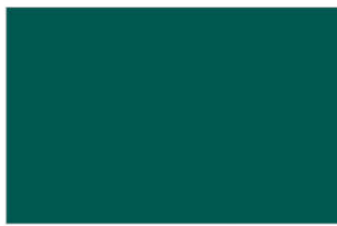
R-3784 Marine Green เขียวสมุทร