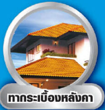
ทากระเบื้องหลังคา