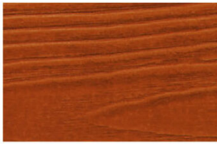
▲ R-3982 สีทังโปร่งแส