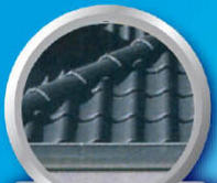
ทากุญแจครอบหลังคา