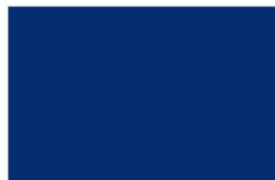
R-3015 ♦ Med Blue น้ำเงินโพลี