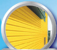
ทามีพาสีเรือบ