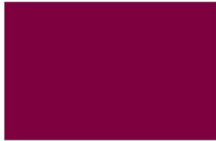
R-3180 Sunny Red แดงตะวัน