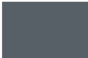
R-3012 Graphite เทากราไฟท์