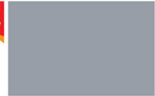
R-3021 Winter Grey เทาเหมันท์