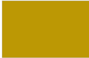
R-3002 Topaz เหลืองราชพฤกษ์