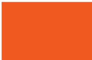
R-3600 ★ Reddish Orange ส้มปะการัง