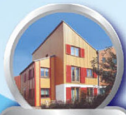
ทาอาคาร บ้านเรือน