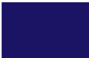
R-3300 ★ Royal Blue แพรคราม