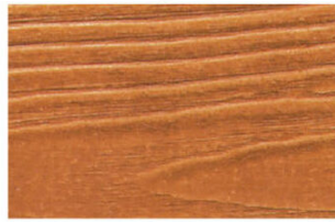
▲ R-3981 สีทังโปร่งแส