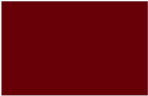
R-3170 Med Red แดงทับทิม