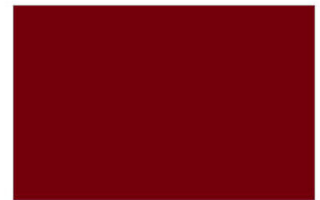
R-3175 Red แดง