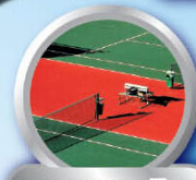
ทาสานเทนนิส