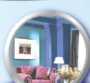
ทาดัดขอบ กันเปื้อน