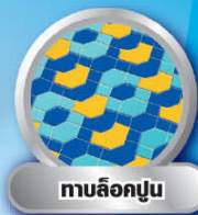
ทาล็อคปูน