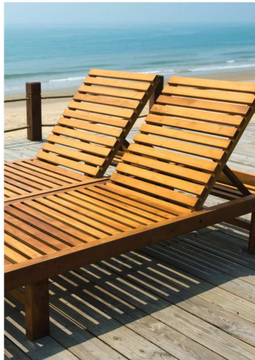
เฟอร์นิเจอร์