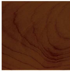
สีน้ำตาลดำ