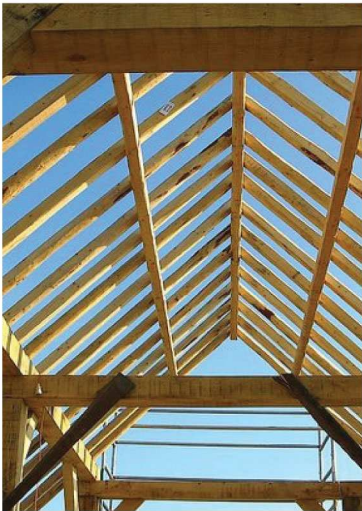
โครงคร่าว