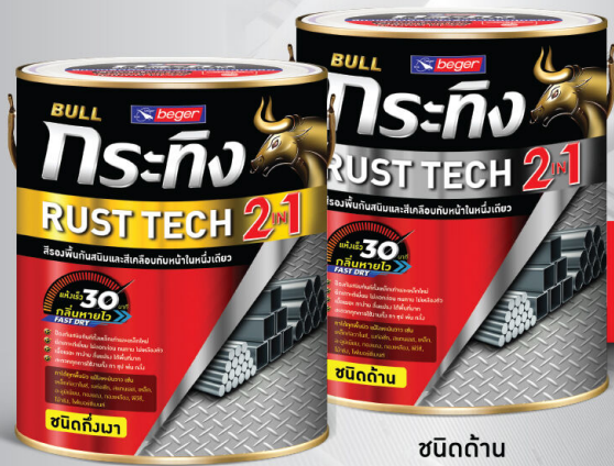
ชนิดเงา/กึ่งเงา