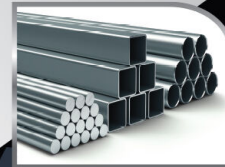
เหล็กชุบซิงค์