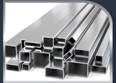
อลูมิเนียม