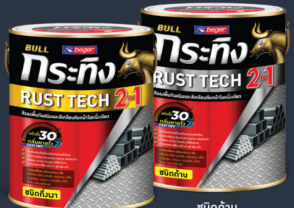
ชนิดเทา/กึ่งเทา