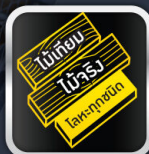
ทาได้หลากหลายพื้นผิว