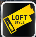
ตกแต่งสไตล์ลอฟท์