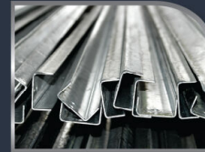
เหล็กกล้าวาโนซ์