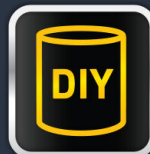
ใช้งานง่าย